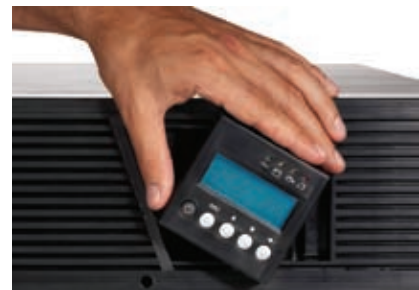
Ecran LCD pivotant