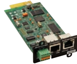
Carte Web/SNMP avec ModBus