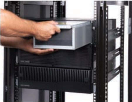
Batteries remplaçables à chaud