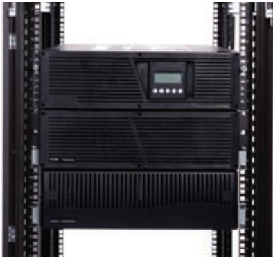
Installation d'un modèle rack avec batteries externes (EBM)