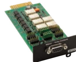
Carte d'interface relais